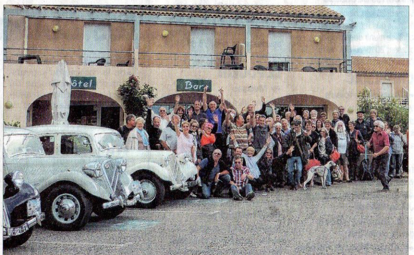
Plus de 50 équipages ont fêté, le week-end dernier, les 40 ans de l'association La Traction Rhône-Alpes.