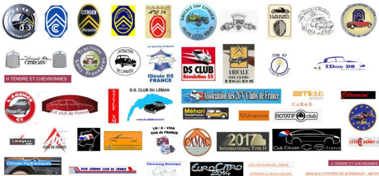
Logos des Clubs de l'Amicale Citroën & DS France