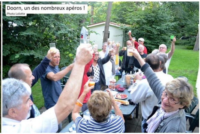
Doorn, un des nombreux apéros !