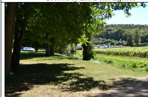
Dernière étape, la Bourgogne