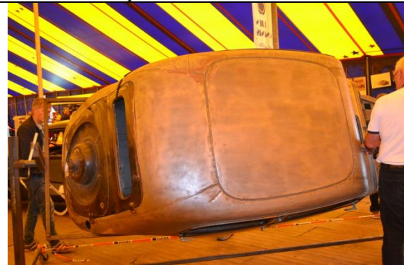
Un vieux citron qui tourne comme une patate