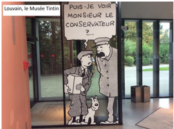
Louvain, le Musée Tintin