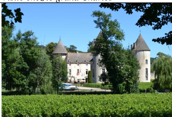
Le château de Savigny Les Beaune