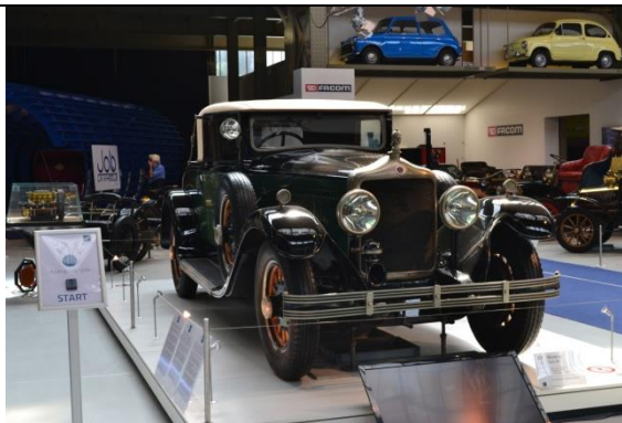
Son beau musée de l'automobile