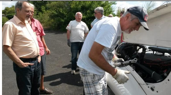
Vite Ray, avec ton déficient et délicat delco, la maison de la pucelle nous attend !