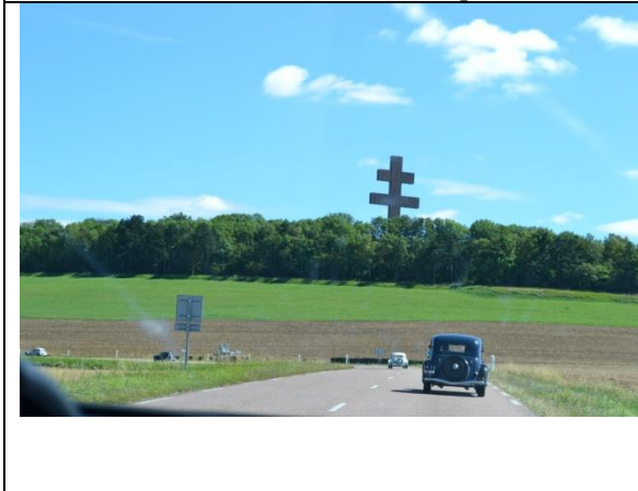
Colomby Les Deux Eglises