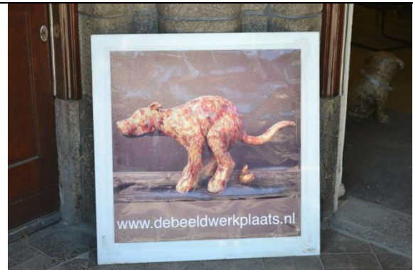
Les rues sont propres, mais ils trichent un peu.