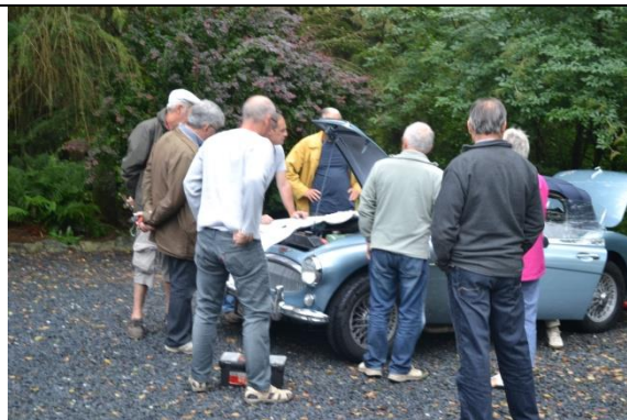
Tiens, une anglaise qui n'aime pas la pluie !