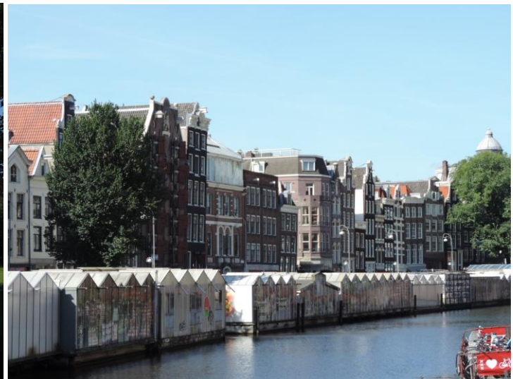
Amsterdam (marché aux fleurs)