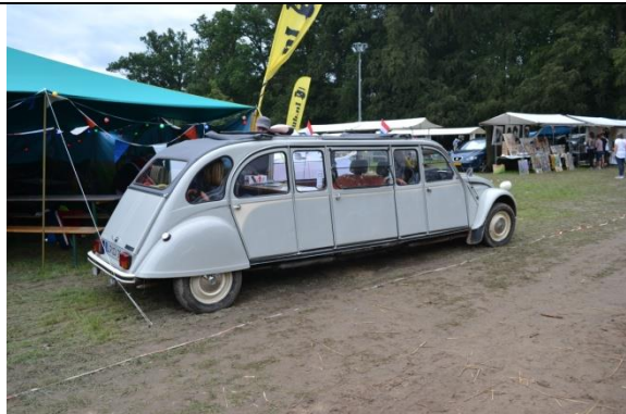
C'est dingue ce qu'ils font avec les 2cv