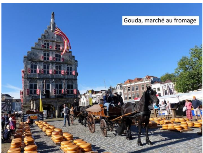
Gouda, marché au fromage