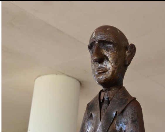
Visite chez le grand Charles