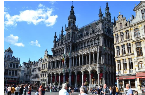
Retour sur Bruxelles