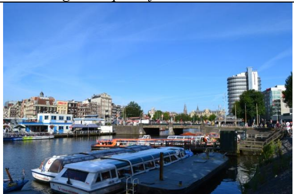
Et il y a Amsterdam et ses balades sur les canaux