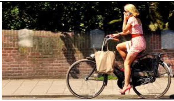
Enfin, la hollandaise et ses beaux vélos