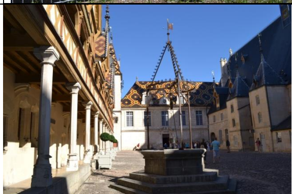
Les Hospices de Beaune