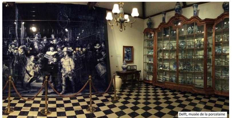
Delft, musée de la porcelaine