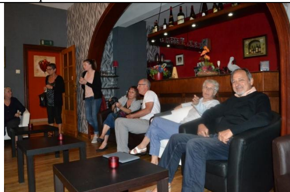
Belgique, il pleut dehors, ça rince dedans.