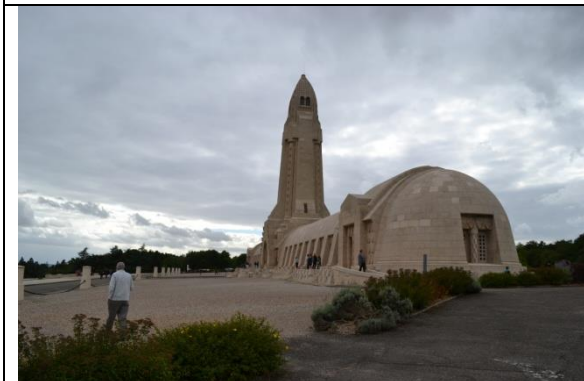
Et la France, Verdun, ses champs de bataille