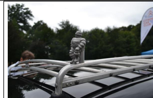
Notre Bib un peu seul