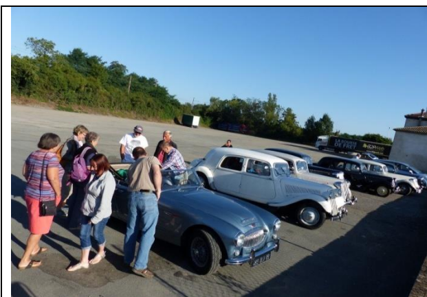
Départ groupé à Villefranche