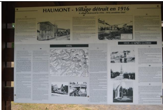
Ne jamais oublier.