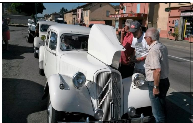
Ca ratatouille sous le capot, petit caprice