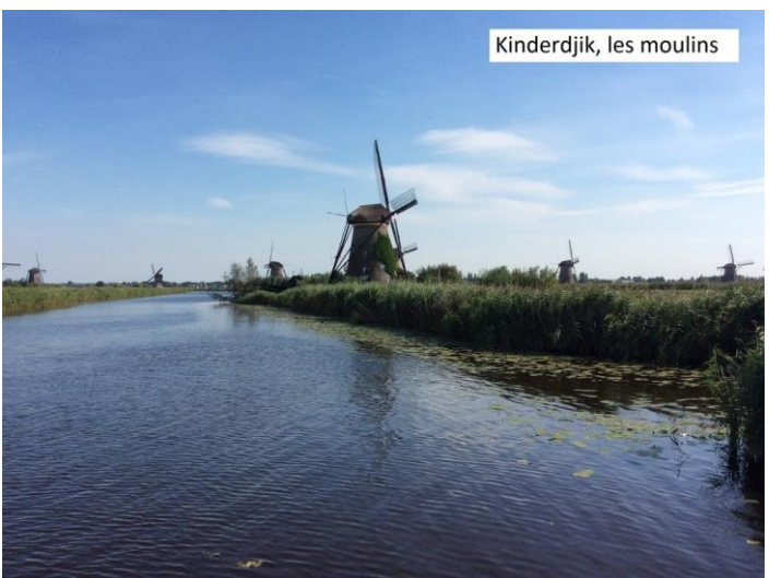
Kinderdijk, les moulins