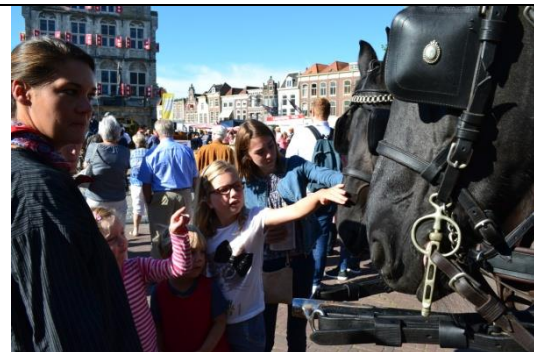
Ses belles blondes et ses beaux bruns.