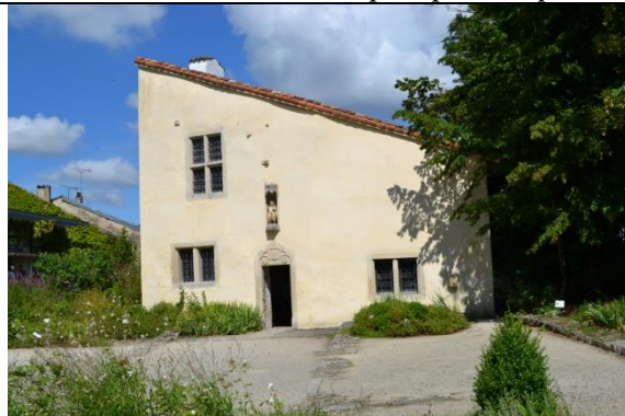
La maison....à Domremy