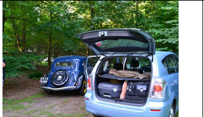
Hélas Il faut penser à repartir