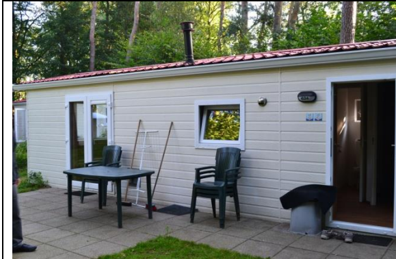
Mais du camping,.....