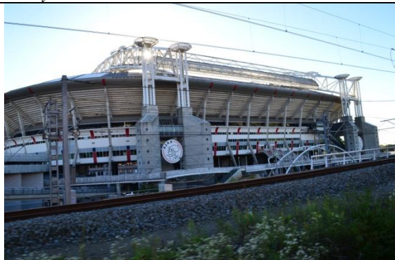
l'AJAX et son stade