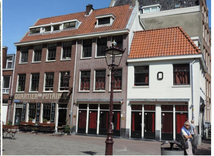
Quartier rouge - Amsterdam