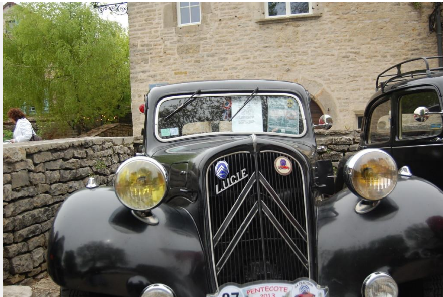
la traction Lucie (BL 11) qui a participé au tournage du film Lucie Aubrac

Dans le cortège il y avait une traction de 1937 : la 11 BL (nommée Lucie, elle a servi au tournage du film Lucie Aubrac avec Carole Bouquet et Daniel Auteuil). À chaque halte du cortège, de nombreux badauds venaient admirer les tractions, et se souvenir du temps passé dans ces fantastiques véhicules.