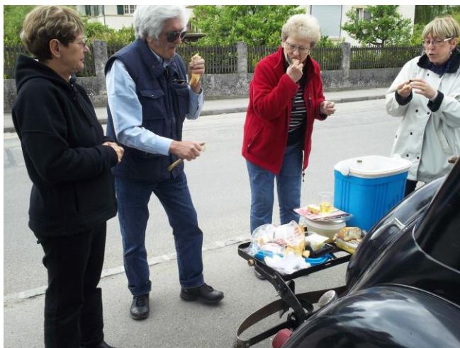
Table de camping ou porte-bagages ?