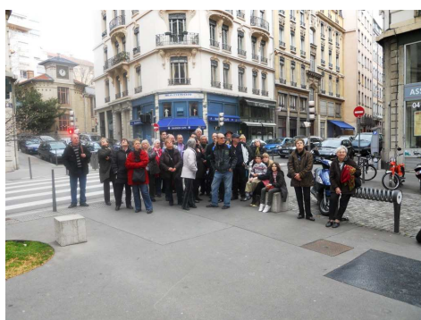
Fresque de le Traction Rhône Alpes