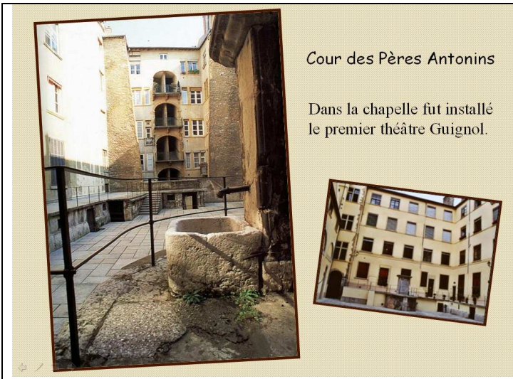
Cour des Pères Antonins

Dans la chapelle fut installé le premier théâtre Guignol.