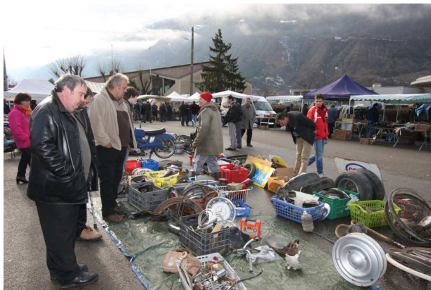
Etal de pièces en plein air malgré la pluie