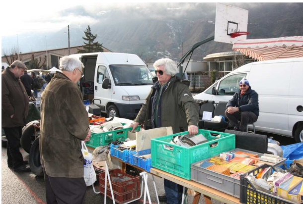
Le travail c'est la santé, ne rien faire c'est la conserver.

Un apéro sympa offert par nos amis de Grenoble a réuni une quinzaine de membres le samedi à midi sous un abri prêté par un des membres vendeur. Même notre membre suisse a fait le déplacement.