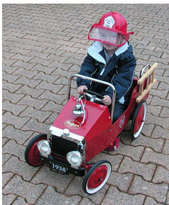
Un Futur membre du Club