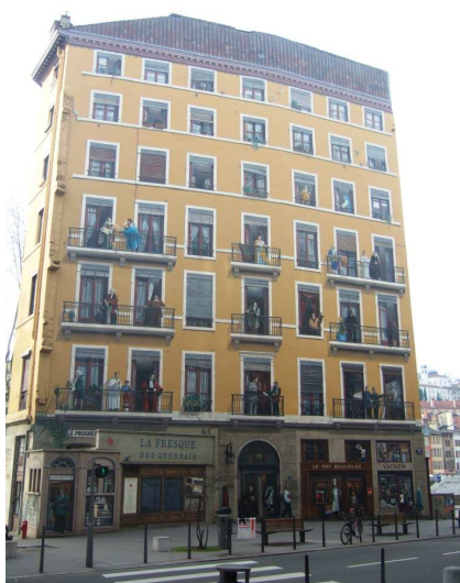
Fresque des Lyonnais