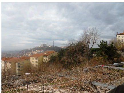
Fourvière vue de La Croix-Rousse