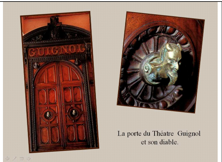
La porte du Théâtre Guignol et son diable.