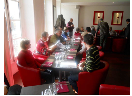
Après la marche, le réconfort