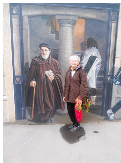
L'abbé Pierre et une bénévoles