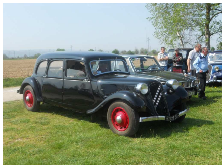
11 Familiale 1939