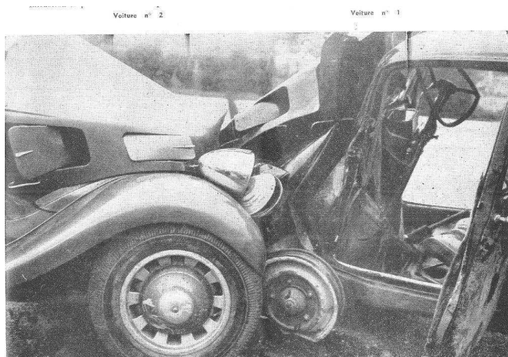
Attention sur la route