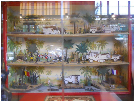
Diaporama (1200 à 1500 €)