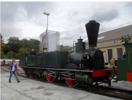
2/4 (GENF 1858)