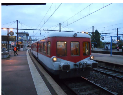
Picasso X 3886