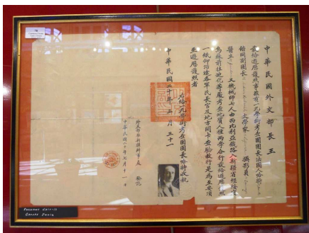
Passeport chinois (3exemplaires : 600 à 800 €) Sahara