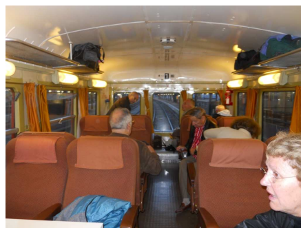
Intérieur 1 ère classe