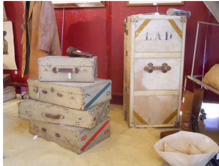
Malles Louis Vuitton (2300 à 2900 €)