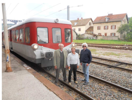
Trois touristes devant un X 3886

Pour les 2 jours nous avons une carte de libre circulation pour l'ensemble des lignes concernées.