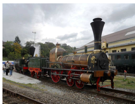
D 1/3 (Limmat 1847)