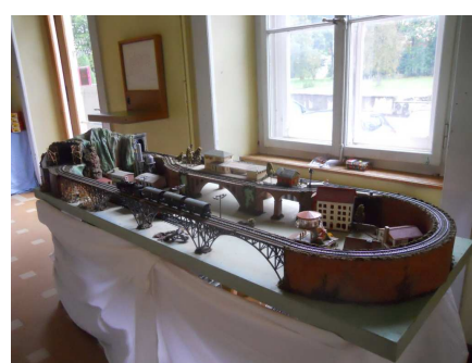
Réseau en gare de Travers (CH)