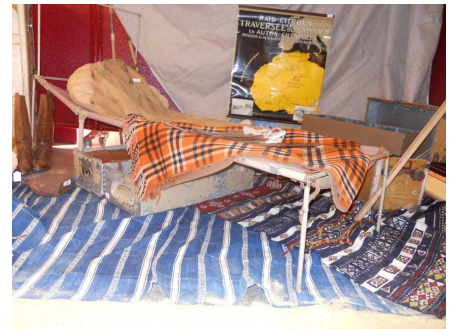
Lit pliant Louis Vuitton (800 à 1000 €)