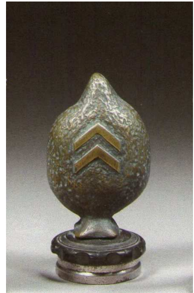
Mascotte automobile Croisière du

(Sanguine d'Alexandre Iacovleff : 10 à 12000 €)