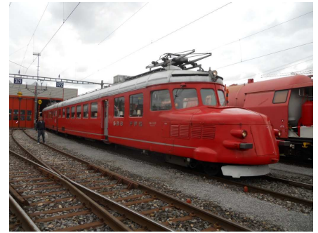
La flèche rouge