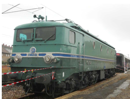
CC 7107 du record du monde à 331 km/h le 28mars 1955