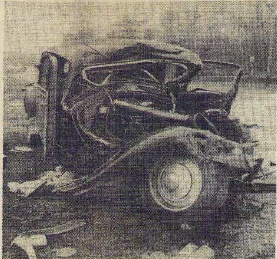
Lorsque vous vous installerez au volant de votre voiture regardez cette image et partez rassurés