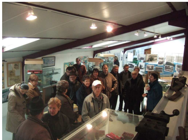
La foule des grands jours