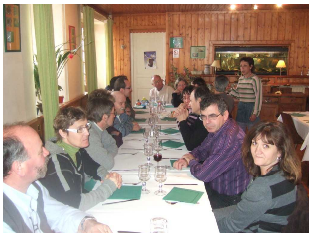
Pendant l'apéritif avant le repas