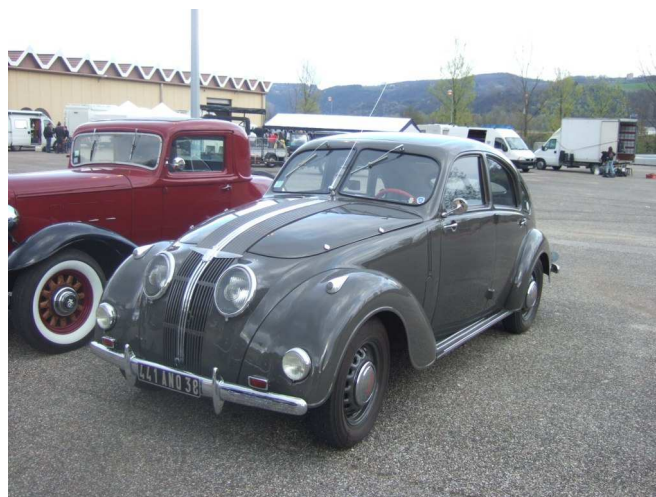
Une très rare ADLER