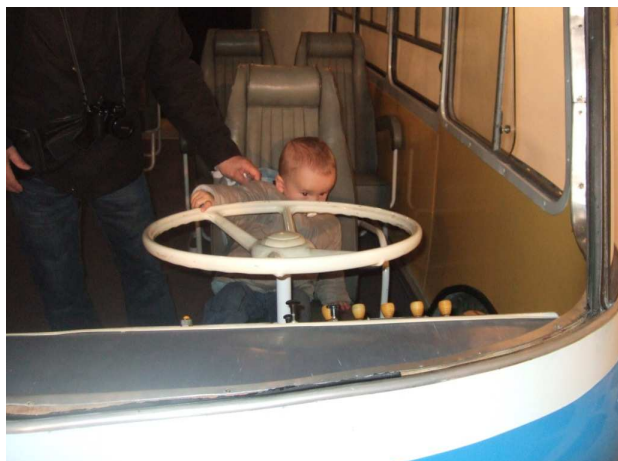
Enfin la relève

Pour une fois tout le monde était à l'heure et nous avons pu partir à 9 heures. La visite du Musée du Charronnage au Car fût très intéressante et a passionnée tout le monde. Le repas copieux a rempli nos estomacs. Certains se sont servis plusieurs fois. La visite du Musée de l'Alambic a permis à quelques membres de goûter à tous les alcools. Nous avons terminé la journée en nous rendant à une concentration de véhicules d'exception. Quelques photos souvenir de cette journée où la pluie fut absente malgré les prévisions météorologiques.