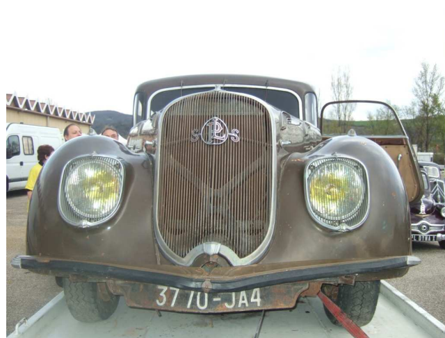
Panhard Levassor Dynamic