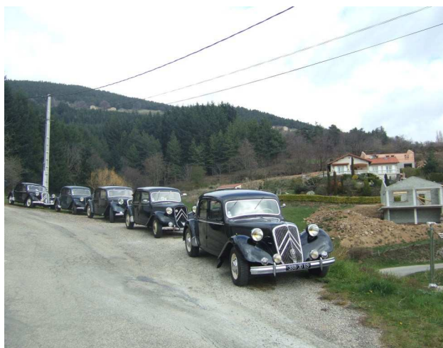
Nos coursiers au repos