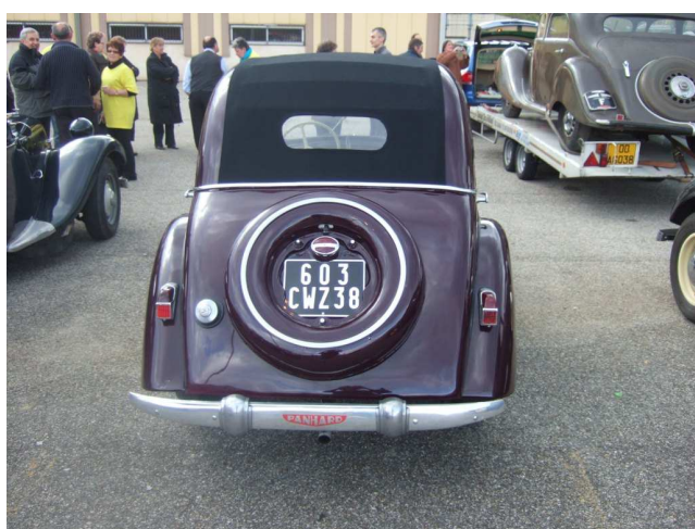
Cabriolet DYNA X