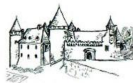
Château de Virieu. Dauphiné – Isère

Laurence.chateaudevirieu@cegetel.net www.chateau-de-virieu.com