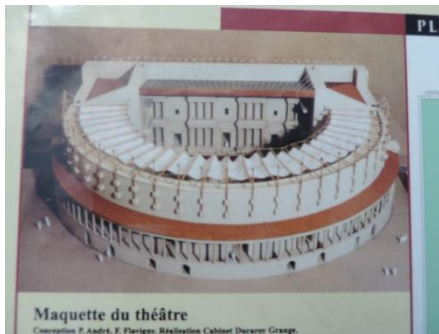
Maquette du théâtre Conception F. André, F. Floriges, Réalisation Cabinet Duranoy Group.