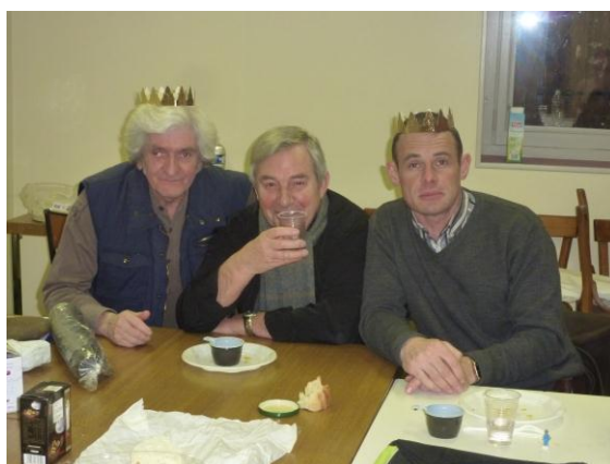
Que fait-on pendant les réunions de bureau ?