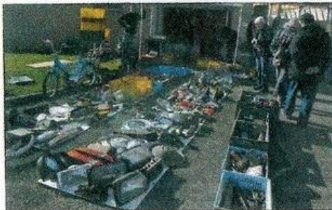
▲ Le déballage à même le sol permet aux chineurs de repérer facilement la pièce convoitée.