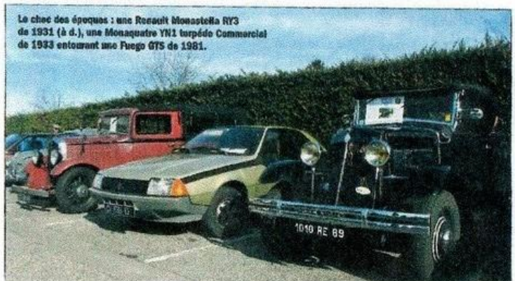
Le chek des époques : une Renault Monastère RY3 de 1931 (à d.), une Monastique VN1 torpédo Commercial de 1933 entourant une Fuego GT5 de 1981.

l'ambiance de la bourse. Notre plus grande satisfaction réside dans le satisfecit de tous lorsque le dimanche soir les portes se ferment, et ça durera comme cela tant que nous serons là. On pense vraiment que c'est cette convivialité qui fait notre succès. »