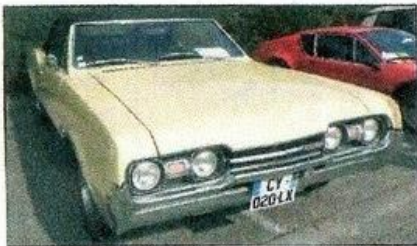
▲ L'Oldsmobile F85 Cutlass Supreme de 1967 est animée par un moteur de 7,2 l de 350 ch. Ce modèle a été élu Top Performance Car of the Year en 1968.