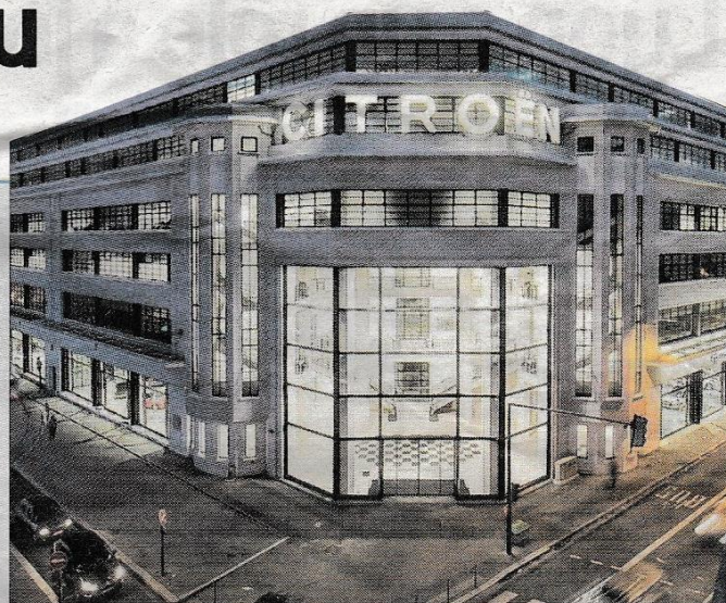
■ Le New Deal a été revendu à un fonds allemand.

Selon Nicolas Gagneux, président-fondateur du Groupe, une dizaine de fonds français et européens étaient en course pour le New Deal « mais c'est le fonds allemand qui a proposé les meilleures conditions ». Le site de 31 500 m 2 qui abrite une école de commerce, l'université Lyon 3, une société d'assurance pour animaux, un espace de coworking et l'institut de sondage Sofres Lyon est selon Nicolas Gagneux entièrement loué.