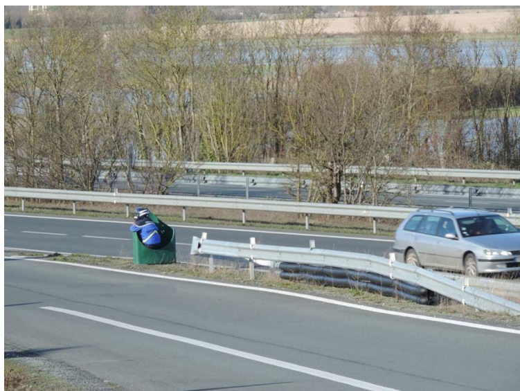
Document fourni par Claude C.