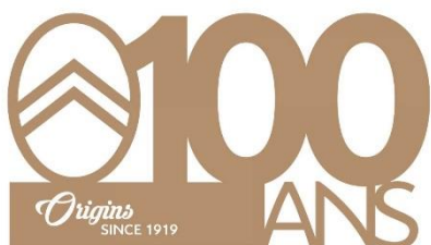
Une sélection du plateau Citroën

A noter que nos adhérents ont reçu les félicitations des organisateurs pour leurs travaux électriques sur le stand.