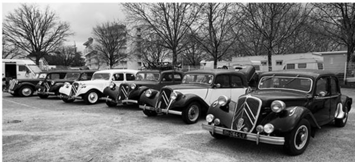
29 février 2020 : Nîmes