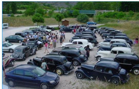
Pentecôte 2003 avec La Traction Rhône Alpes