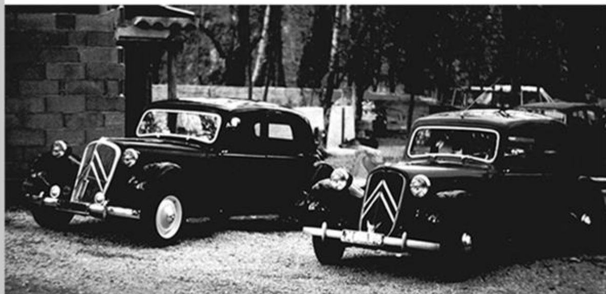
15 mars 1975 : création du Club