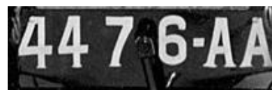
Plaque de 1922 (Alès)

Ci-dessous, deux cartes permettent de situer le lieu d'origine de l'immatriculation.