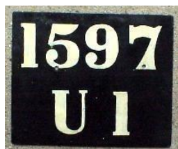
Plaque de 1914 (Paris)

En 1901 les données nominatives disparaissent au profit de lettres faisant référence à des arrondissements minéralogiques couvrant plusieurs départements. En 1922 le système sera légèrement modifié, mais restera, dans les grandes lignes, semblable au système de 1901.