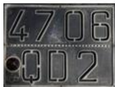
Plaque de 1933