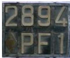
Plaques de 1928