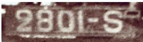
Plaque de 1922 (Rhône)