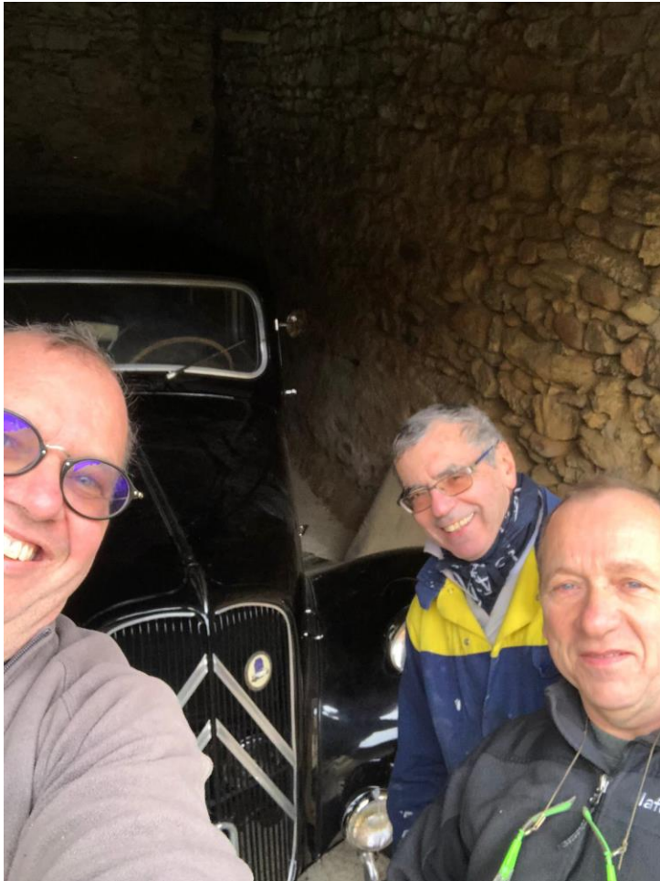
Changement d'embrayage chez GéraAAAAAARD