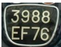
Seine Maritime 1975