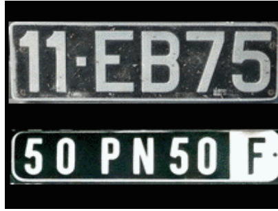
Seine 1954 et Manche 1971 FNI