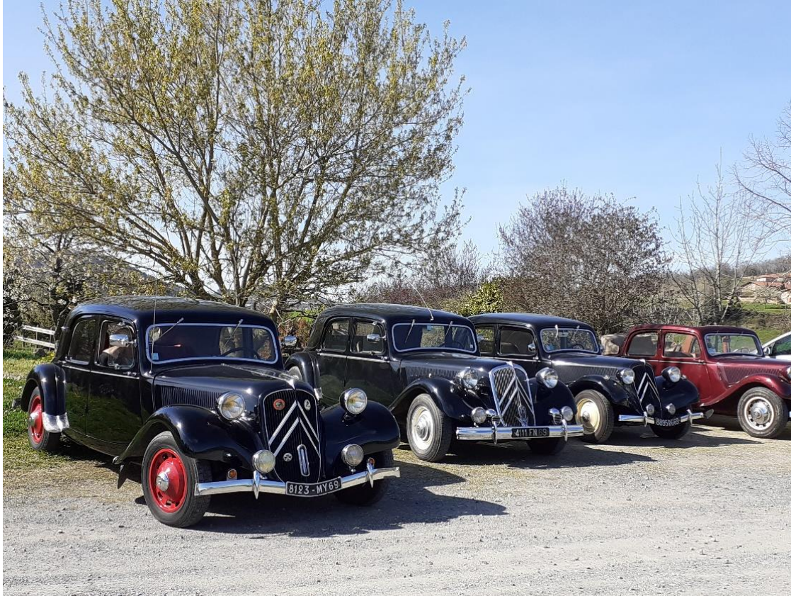
Les trac sur le parking du restaurant