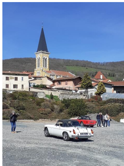
Le clocher de Brullioles