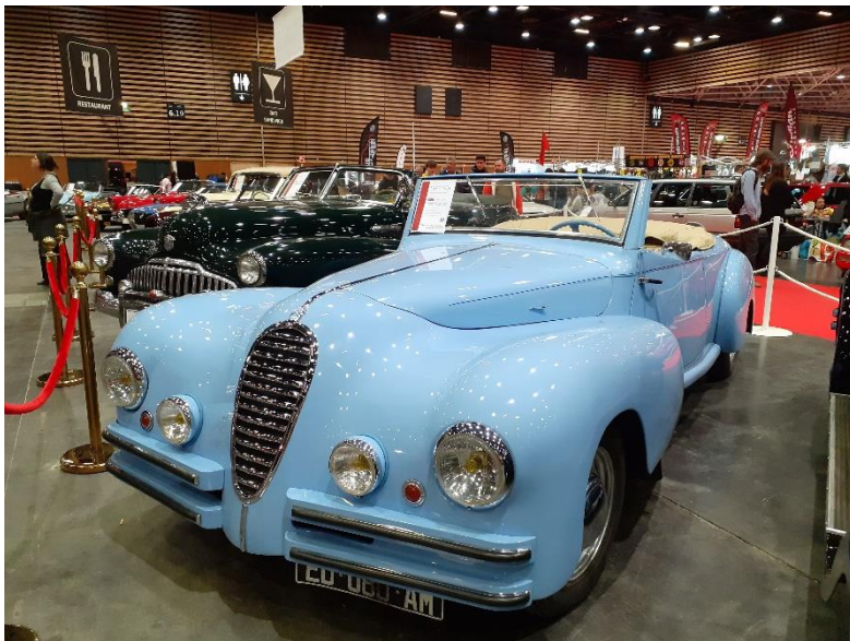
Citroën 11b 1938 Cabriolet Renard et bec