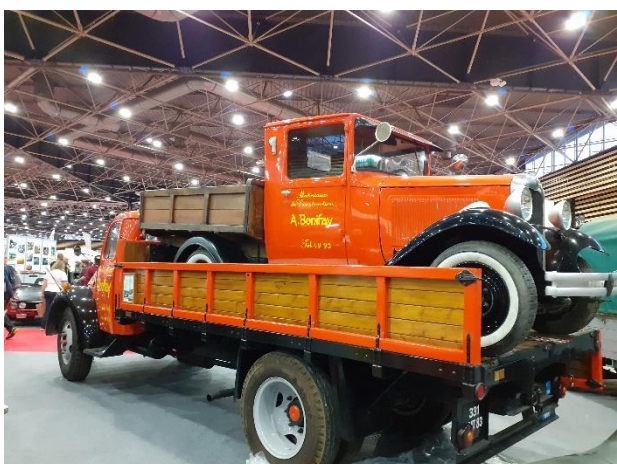
Il faut être prévoyant