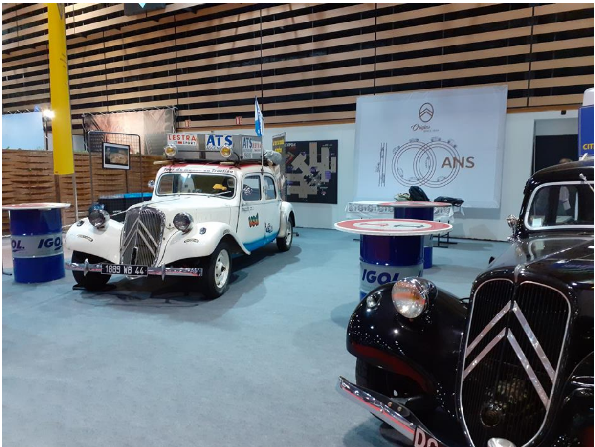
Cambouis et Bernadette côte à côte sur le stand