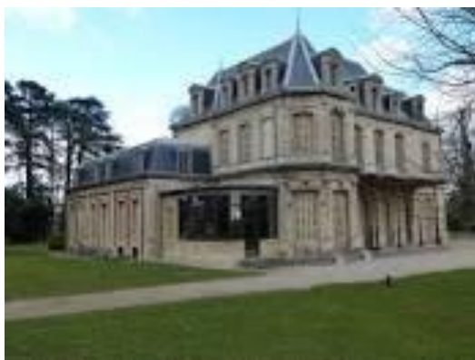
La Mairie de Sathonay Village

Le Président soumet l'idée de réintégrer cette association qui permet aux passionnés de la région lyonnaise de se rencontrer dans le parc de la Mairie de Sathonay Village. Le fait d'adhérer implique pour chaque club d'assurer une fois par an (en fonction du nombre de clubs) l'accueil des véhicules dans le Parc de la Mairie de tenir la buvette. Jusqu' à présent le Rencard nous prêtait du matériel pour Villette et nous reprenait une partie des invendus boissons.