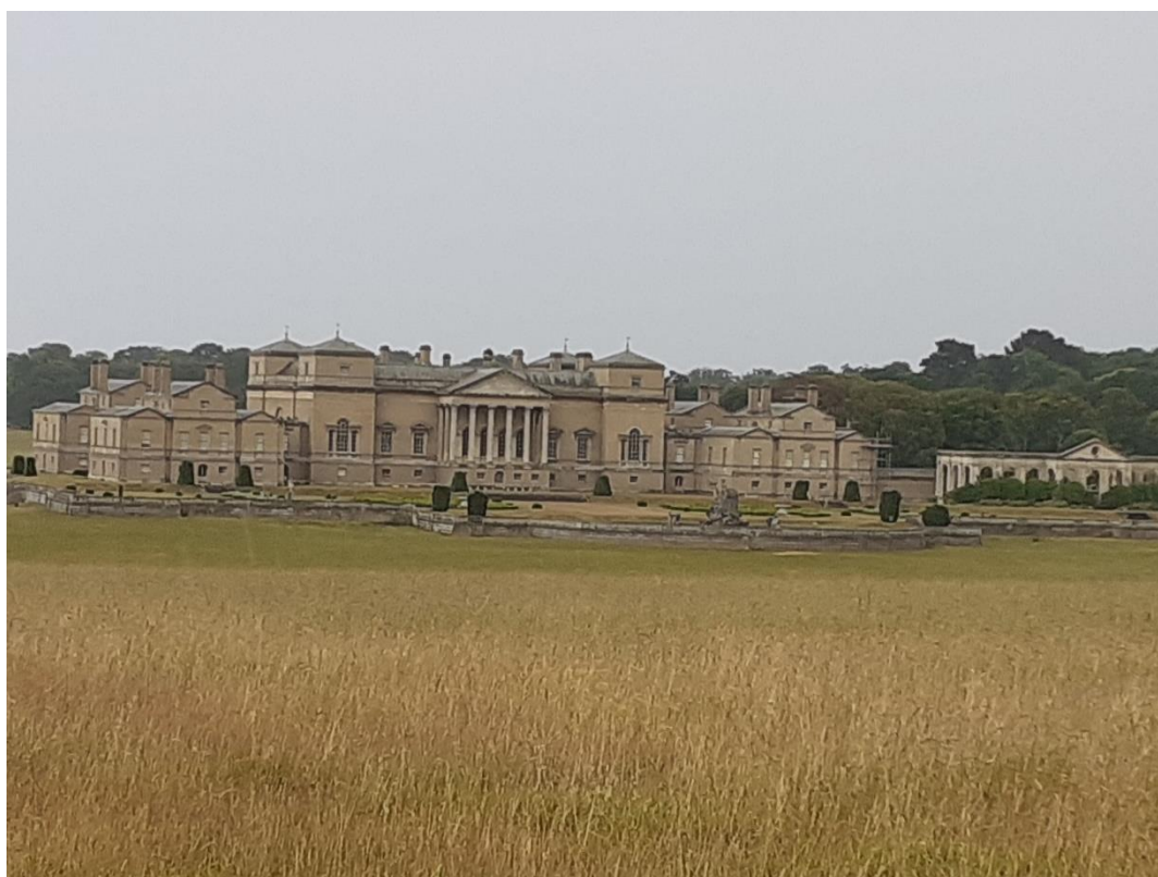
Holkham Hall la petite demeure du Comte de Leicester (côté pile)

Nous nous sommes inscrits à l'international meeting du Club Healey organisé en East Anglia, l'occasion de découvrir une partie de l'Angleterre que nous ne connaissons pas et de rencontrer 69 passionnés de petites anglaises. Le temps fut avec nous. Expérience so british très sympa.