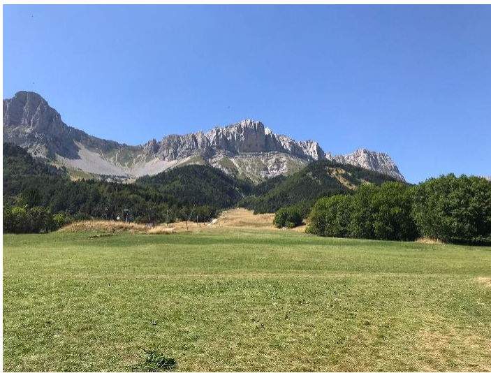
Une vue magnifique sur les sommets du Vercors