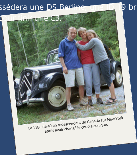
La 11BL de 49 en redescendant du Canada sur New York après avoir changé le couple conique.