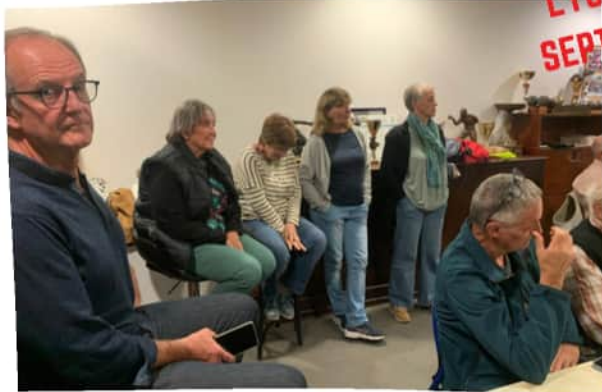
LYON 18 SEPT. 2024

Avec 30 participants, cette réunion fut animée, les sujets primordiaux pour le développement de notre club ont suscité d'intéressantes suggestions.