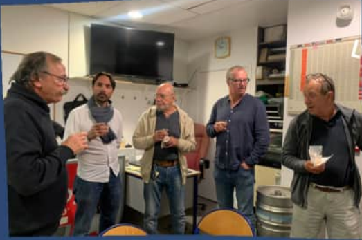
LYON 20 SEPT.

La première réunion de l'année s'est tenue en comité réduit mais de qualité !