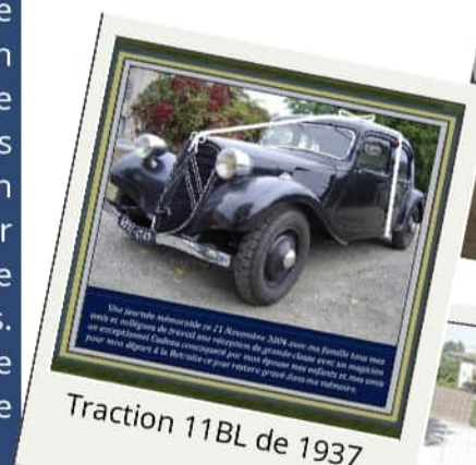
Traction 11BL de 1937

Lionel BONNIN à pris sa retraite en 2004 dans un flot d'émotions à l'issue d'un défilé de surprises....Il reçoit un incroyable cadeau ! Il nous raconte :